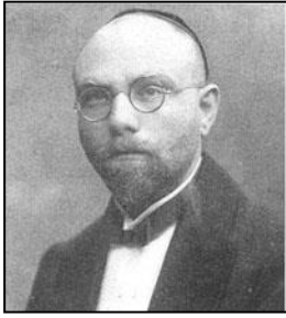
Jacob Israël de Haan.

Wij beschikken niet over namen van leerlingen of docenten van het Instituut Wegerif. Eén naam willen wij kort beschrijven.