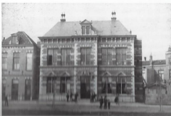
Het hoofdgebouw van Instituut Wegerif, 'Instituut voor Jongheeren', aan de Van der Bruggenstraat 5 in Nijmegen, 1890.