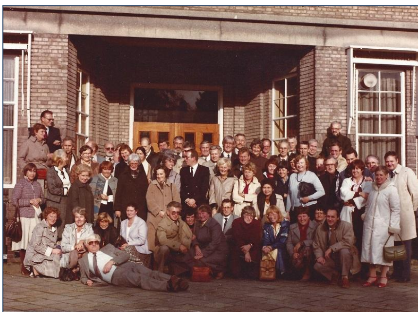
NSV Reünie November 1981

1981 - 2014 - 2016 - 2018 – 2019 in 2020 mogelijk de laatste.