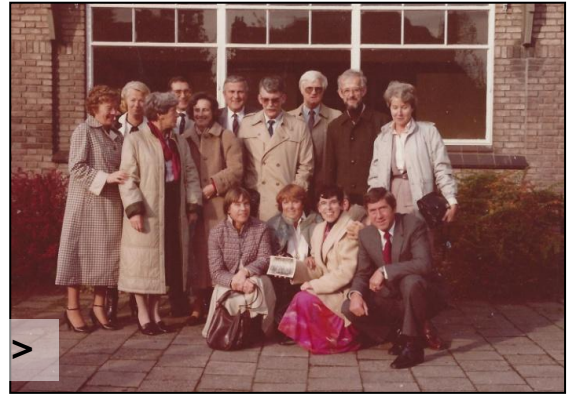
NSV-4 1948-1949 Klas-4