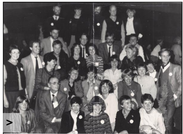
NSV-4 MULO 1958-1959 Klas-2b. Voor de namen kijk bij de klassenfoto's.