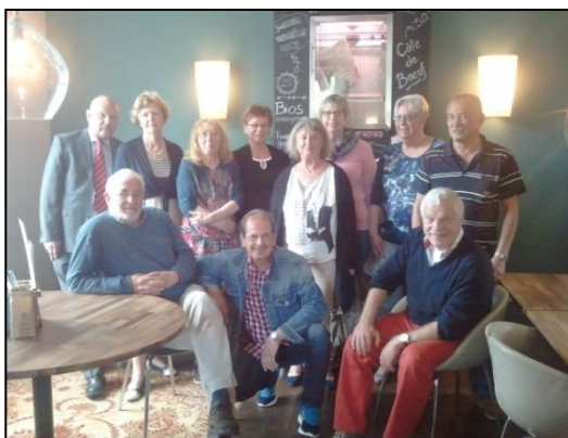
Tsjechië ploeg mei 2017